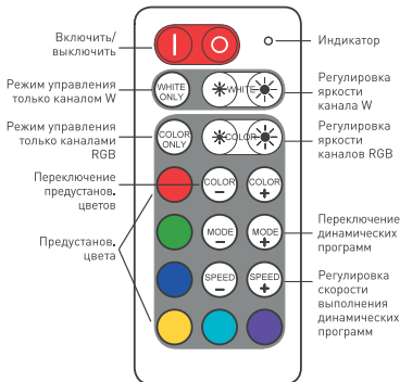
Рисунок 2. Назначение кнопок пульта ДУ.

отпустите их через 3 секунды. Трехкратное мигание светодиодного индикатора на контроллере зеленым цветом подтвердит успешную привязку пульта. В случае срабатывания защиты светодиодный индикатор на контроллере может светиться разным цветом: мигающий красный — защита от перегрузки или короткого замыкания, мигающий желтый — защита от перегрева. Устраните причину срабатывания защиты, и через некоторое время контроллер вернется в рабочий режим.